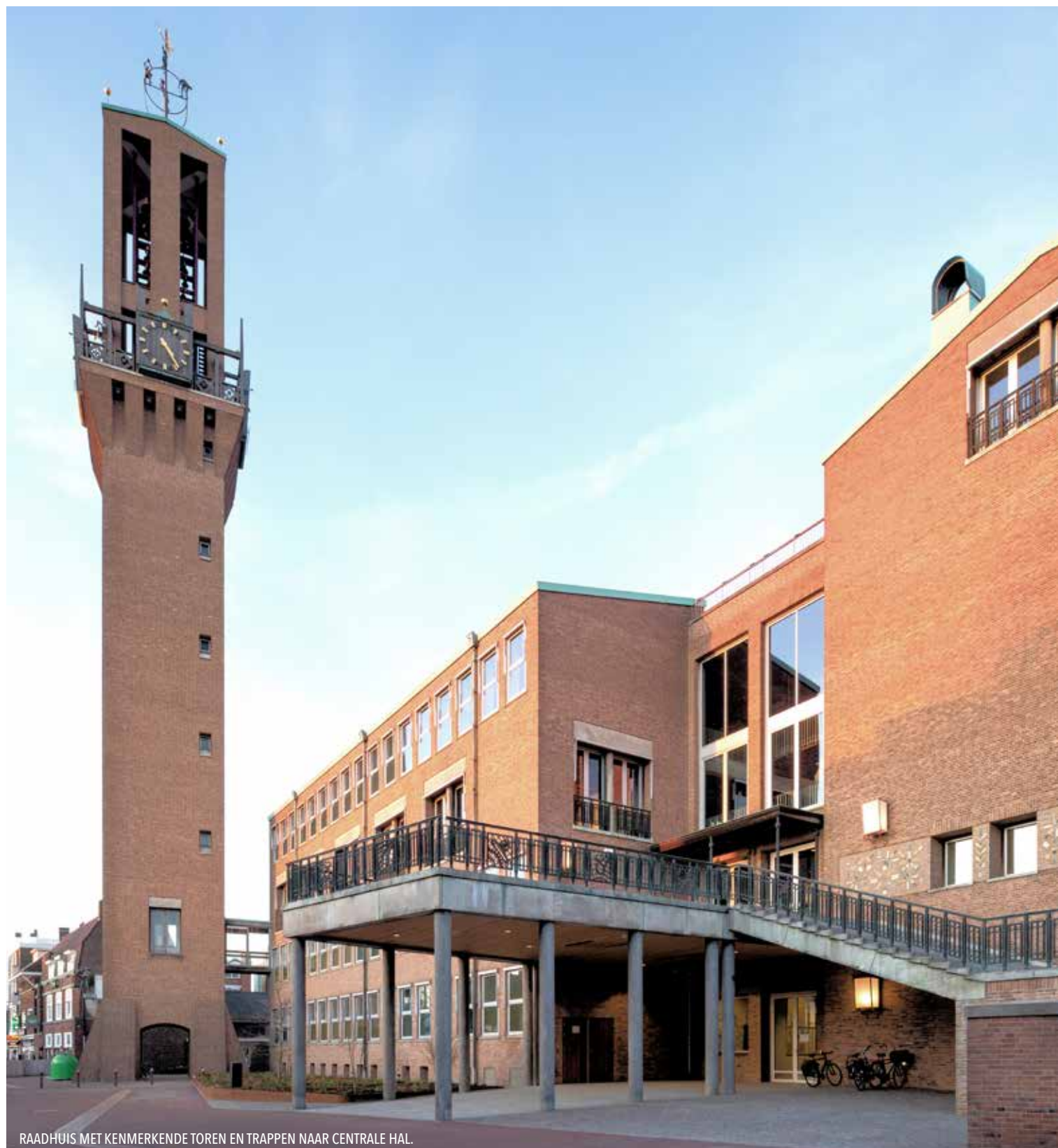
RAADHUIS MET KENMERKENDE TOREN EN TRAPPEN NAAR CENTRALE HAL.

Renovatie raadhuis Hengelo is compliment aan oorspronkelijk ontwerp